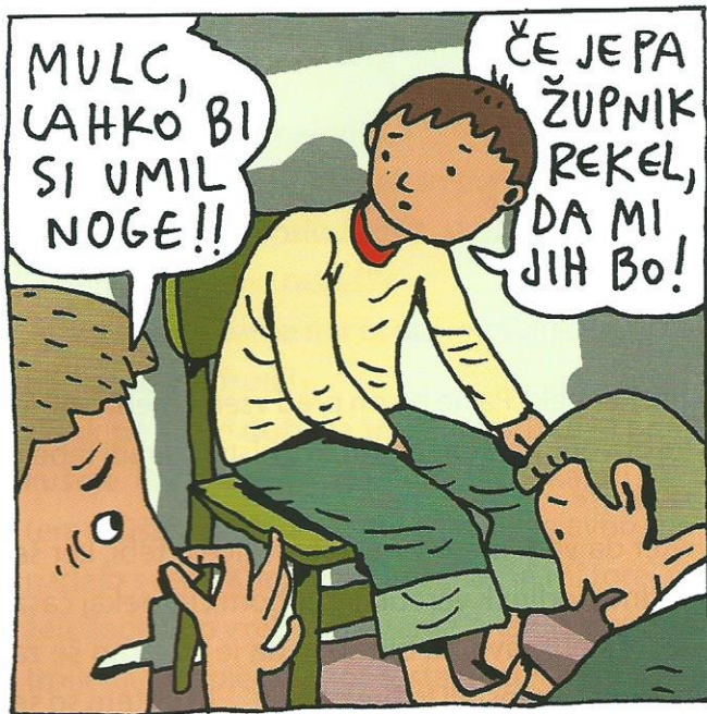
Očitno sem ga samo jaz vzel resno!