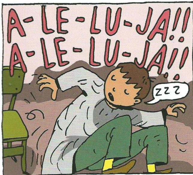
Pevci so zapeli tako glasno, da bi še mrtvega prebudili!