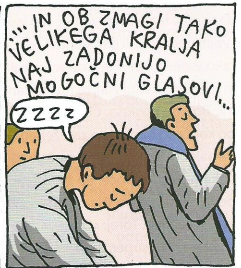
... zato ni nič čudnega, da sem med velikonočno vigilijo omagal!