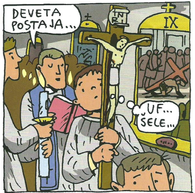
Na veliki petek sem šel v cerkev, čeprav ni maše!