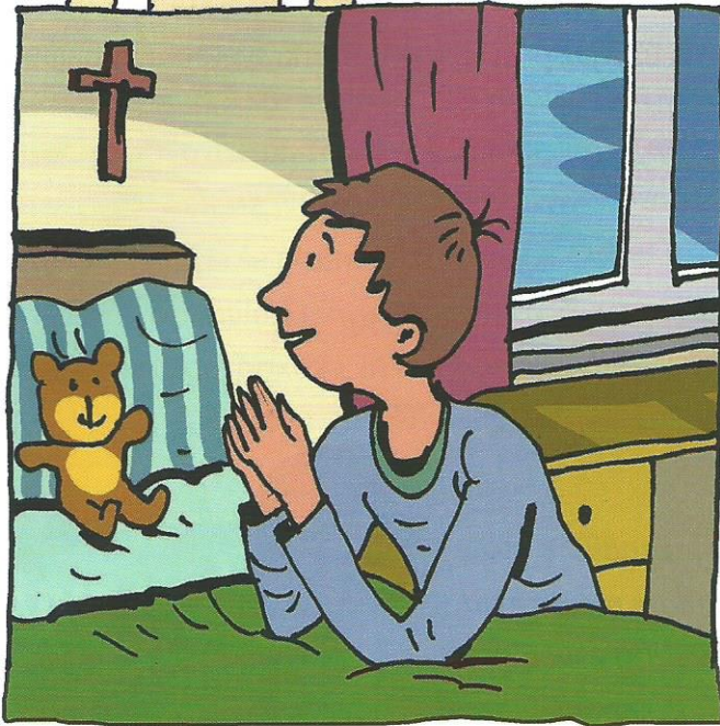
Ljubi Bog! Velika noč je mimo in tudi jaz sem trpel po svoje.

Piše Gregor Čušin Riše Damijan Stepančič